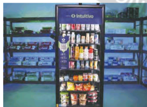
Las máquinas utilizan IA

Intutivo, empresa argentina líder en tecnología de puntos de venta autónomos (A-POPs), anuncia su expansión en el mercado estadounidense dentro de las principales ligas deportivas del país: NBA, NFL y MLB. La firma proyecta instalar más de un millón de A-POPs, que ofrecen una propuesta única al ser capaces de adaptarse a las preferencias de los consumidores en cada ubicación, permitiendo transacciones simultáneas.