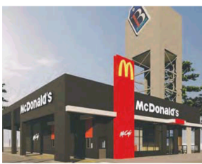
El local estará en Adrogué